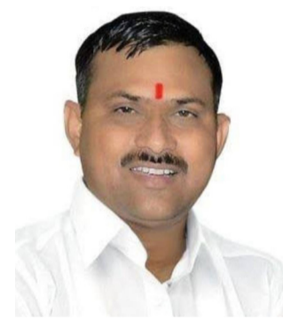
पालकमंत्री भाजपचा की शिवसेनेचा ?

रिविचारी मंत्रिमंडळ विस्तार असल्याने महायुती पदाधिकाऱ्यांना मोठी अशा लागू होती. सकाळपासूनच त्यांच्या नजरा टीव्हीवर येणाऱ्या नावाकडे होत्या. दुसरीकडे, आपल्या नेत्यांचे नाव झळकत नसल्याने कानही फोनाफोनीत बिड्डी होते.