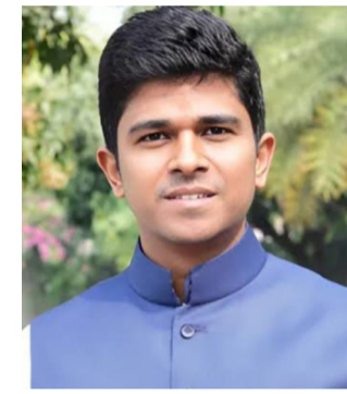
सत्ता असूनही पदाधिकारी निराश