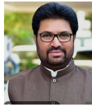
डोळे टीव्हीकडे, कान फोनवर...

दोनदा झेंडावंदन करण्यासाठीच येत असल्याने जिल्ह्याचा अपेक्षित विकास होत नाही. बाहेरच्या पालकमंत्र्याला या जिल्ह्याच्या विकासचं तसेच बाकी लोकांचं काय चाललं, काय हवं यांचं काही देण-घेण नसतं. कोणीही यावं आणि टपली मारून जावं असा हा प्रकार असतो. स्थानिकचा मंत्री असल्यावर वेगळी परिस्थिती असते. त्याचा प्रशासनावर कंट्रोल असतो. जिल्हातील महत्त्वाच्या समस्या मांडल्या जातात, त्या लवकरात लवकर मार्ग लावण्यासाठी प्रयत्न होतात. लोकांनी महायुतीला इतकं भरभरून दिलं. जसं माल जास्त आला तर भाव पडतं तसं अगदी तसच मंत्रीमंडळात झालं आहे. काठावर बहुमत असतं तर सरकारने एवढी शेखी मिरवली असती का ? एवढी सत्वपरिक्षा पाहिली असती का ? अनेकांचा करेक्ट कार्यक्रम केला असता का ? मतदारांनी महायुतीला दिलेल्या महाकौलाचा अपमान करण्याची हिंमत शिंदे फडणविसांमध्ये आली असती का ? असे अनेक प्रश्न जालना जिल्हातील महायुतीच्या पाठीशी खंबीरपणे उभे असलेल्या मतदारांना सतावत असून, आगामी स्थानिक स्वराज्य संस्थांच्या निवडणुकीत या प्रश्नांची उत्तरे शोधावी लागणार आहेत.