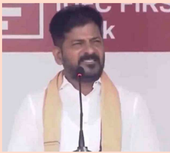
దానికోసం ఇప్పటి నుంచి ప్రణాళికా బద్ధంగా పనిచేస్తామని చెప్పినట్లు వెల్లడించారు.

హైదరాబాద్: మనవెలుగు: 2036లో హైదరాబాద్ లో ఒలింపిక్ గేమ్స్ నిర్వహిస్తామని ముఖ్యమంత్రి రేవంత్ రెడ్డి అన్నారు. ఈ మేరకు తమకు అవకాశం కల్పించాలని ప్రధాని మోదీని కోరినట్లు చెప్పారు. అంతర్జాతీయ స్థాయిలో పనులు కల్పించడానికి సిద్ధంగా ఉన్నామని తెలిపారు. ఎన్ఎంసీ హైదరాబాద్ మార్థాన్ విజేతలకు గచ్చిబౌలి స్టేడియంలో సీఎం రేవంత్ రెడ్డి బహుమతులు అందేశారు. ఈ సందర్భంగా ఆయన మాట్లాడుతూ.. 2036లో ఒలింపిక్స్ను భారత్ లో నిర్వహించాలని ప్రధాని మోదీ ఆలోచన చేస్తున్నారని తెలిపారు. విశ్వకీడలను హైదరాబాద్ లో నిర్వహించేందుకు అవకాశం ఇవ్వాలని కోరామన్నారు. అంతర్జాతీయ స్థాయిలో స్టేడియాలను నిర్మిస్తామని, పనులు కల్పిస్తామని చెప్పారు.